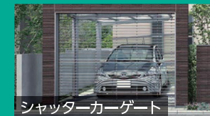
シャッターカーゲート