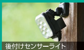
後付けセンサーライト